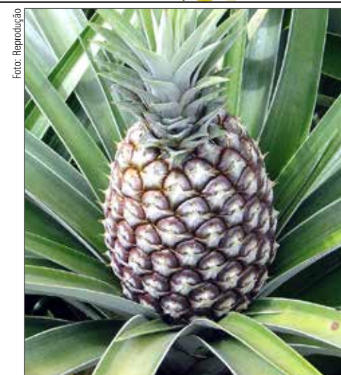
Minas Gerais produziu no ano passado mais de 250 milhões de unidades do fruto

(*GUSTAVO AGUIAR é zootecnista e analista de mercado da Scot Consultoria