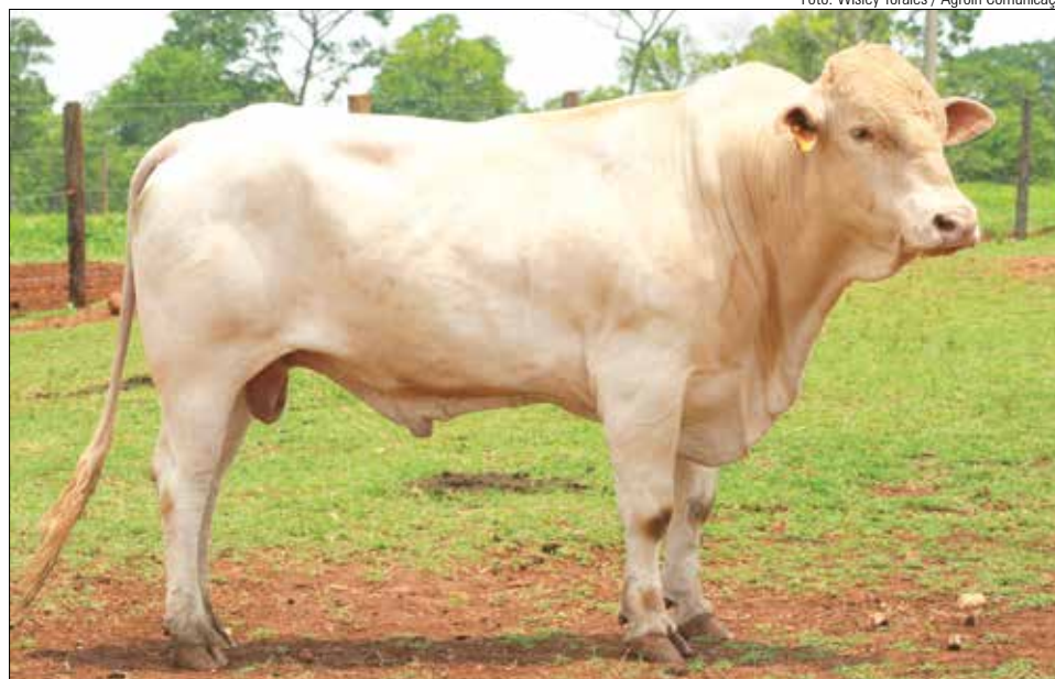
FAULADI DA RECANTO estará a venda dia 30 no 2º Leilão Virtual Canchim Jóias do Campo