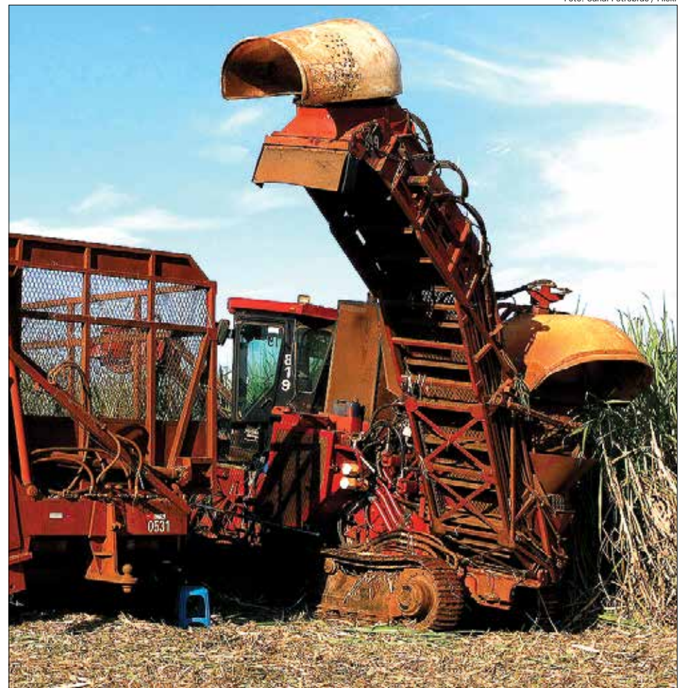
Segundo o IBGE, a falta de renovação dos canaviais e a diminuição da quantidade de insumos aplicados também foram fatores que agravaram a queda de produtividade

No Estado de São Paulo, a área colhida apresentou um crescimento de 4,4% (219.207 hectares). O rendimento médio, no entanto, caiu 4%, diminuindo de 85.543 quilos por hectare (kg/ha) para 82.093 kg/ha, de 2010 para 2011. O Estado continua sendo o maior produtor nacional de cana-de-açúcar, respondendo por 58,2% da produção do país. Continua na página 3.