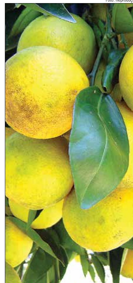
Teto do financiamento para citricultores será de até R$ 100 mil, com prazo de pagamento de 60 meses

O Diário Oficial também divulgou nota sobre a mudança nos parâmetros para enquadramento dos produtores no Feap. A determinação agora é que o limite de até R$ 600 mil de renda agropecuária anual passe a representar, no mínimo, 50% (e não mais 80%), do total da renda bruta anual dos produtores rurais beneficiários dos projetos de crédito e de subvenção econômica do Fundo, como Pró-Trator e Pró-Implemento.