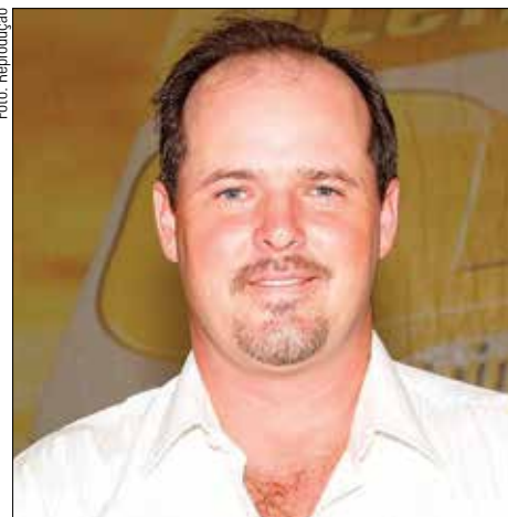
Hernandes diz que produtores estão fechando no vermelho há 5 meses

Com o intuito de pedir apoio ao governo federal, movimento idealizado em Mato Grosso do Sul ganhou adesão de outros nove estados onde a reivindicação é a mesma: fim da importação indiscriminada e mais incentivos para o setor