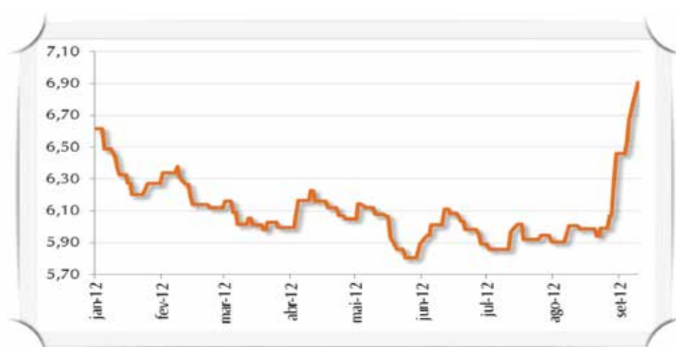
FIGURA 2. Preço da carcaça bovina no atacado (boi casado), em R$/kg, em São Paulo.