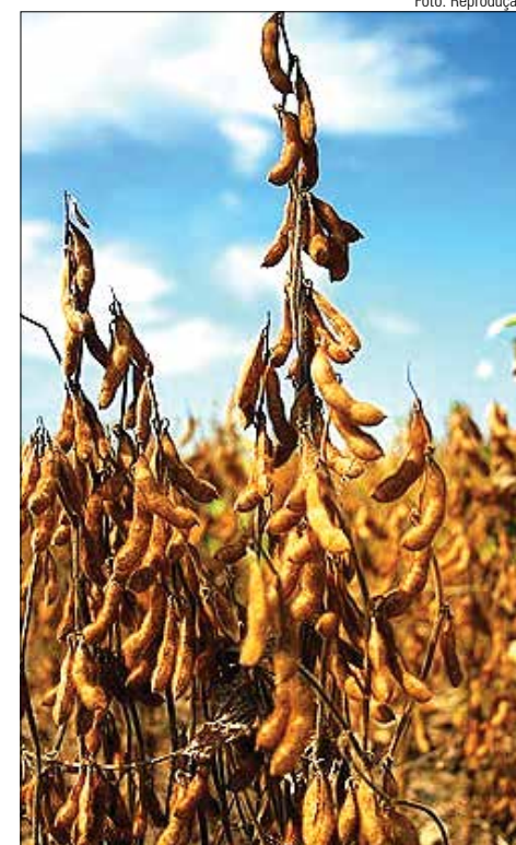
Previsão da Aprosoja é de que produção atinja seis milhões de toneladas. Na safra passada, foram colhidas 4,7 milhões de toneladas de soja

O milho safrinha ganhou espaço do trigo no sul do Estado. A área de trigo que era de 100 mil hectares em Mato Grosso do Sul caiu para os atuais 35 mil hectares,