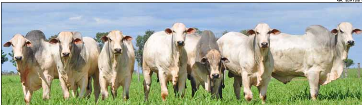
Animais que estarão a venda dia 16, a partir das 13 horas (MS) no Leilão Fazenda São Thomáz em Maracaju durante a Expomara 2012

Leilão ofertará 60 touros Nelore PO e 10 fêmeas Nelore PO Elite