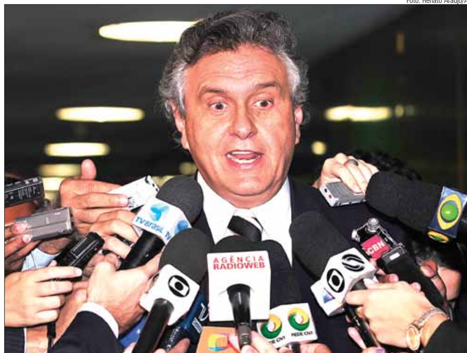
O deputado Ronaldo Caiado assinou a representação para derrubar a MP editada pela presidente Dilma Rousseff

Na representação, os deputados chegam a citar um livro do vice-presidente Michel