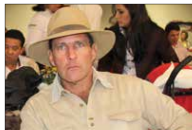
Kadu da Senepol 77K