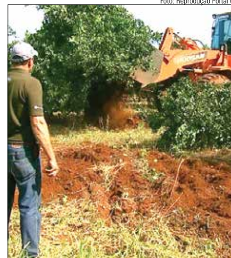
A saída de produtores da citricultura vem crescendo nos últimos anos por meio do arrendamento das áreas para as usinas de cana-de-açúcar