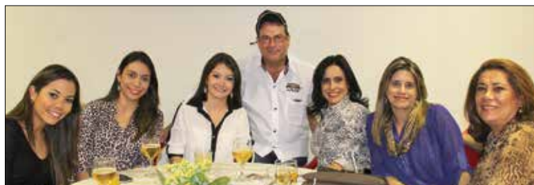
E quem disse que pecuária é coisa só pra homem...